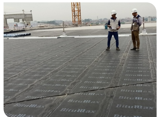
Bề mặt hoàn thiện