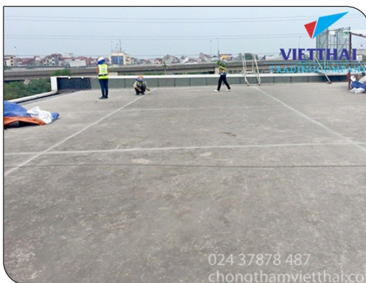
Chuẩn bị bề mặt