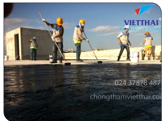
Thi công lăn lớp lót