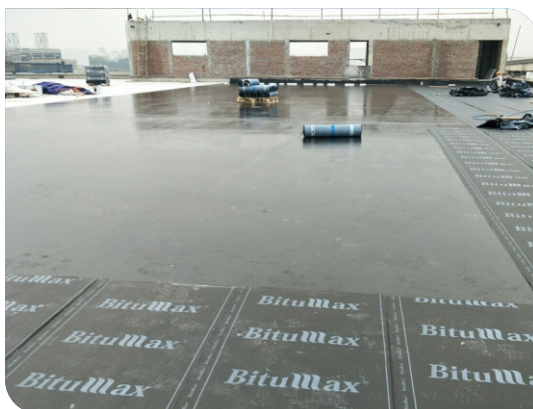
Thi công màng tự dính