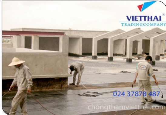
Thi công màng khô nóng