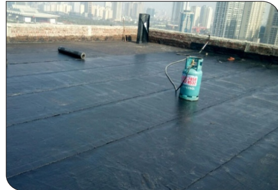
Bề mặt hoàn thiện