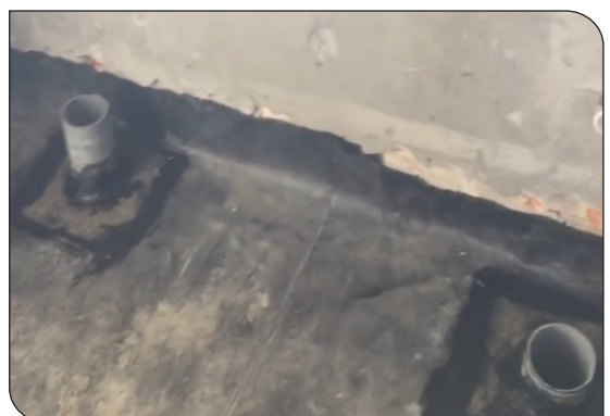
Hoàn thiện cổ ống và góc chân tường