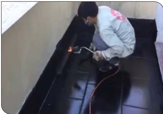
Xử lý góc chân tường