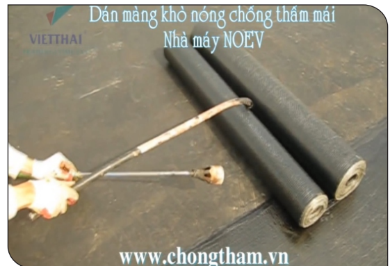
Cách khò tiêu chuẩn