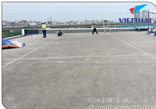
Chuẩn bị bề mặt