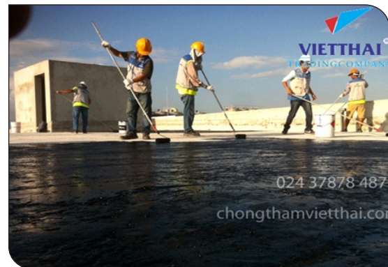
Thi công lăn lớp lót