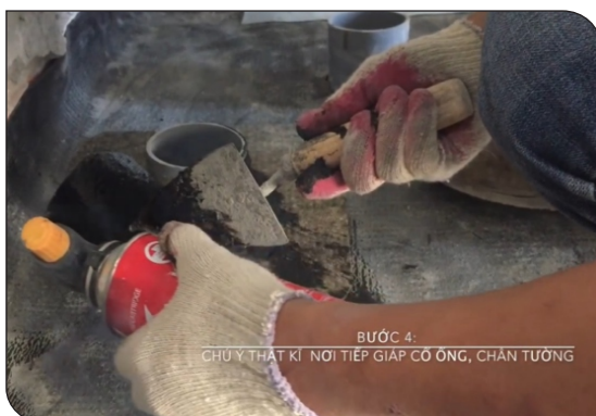
Xử lý cổ ống thoát nước