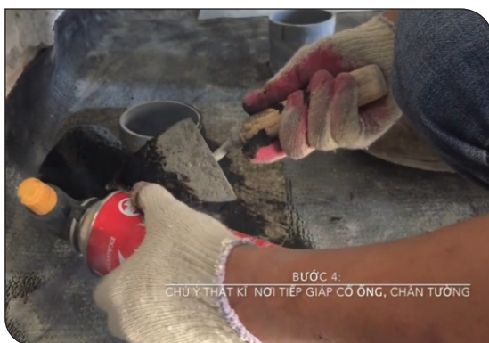
Xử lý cổ ống thoát nước