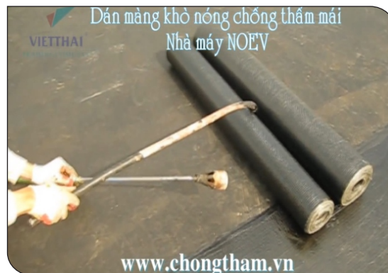
Cách khò tiêu chuẩn