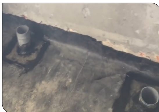
Hoàn thiện cổ ống và góc chân tường